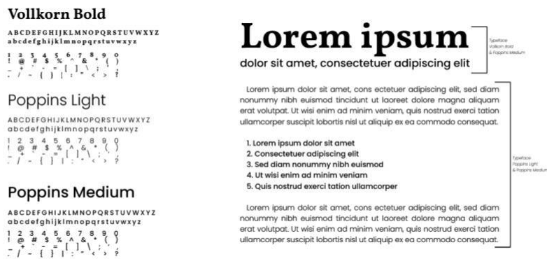
Gambar 2. Font tipografi

Tipografi yang digunakan pada perancangan visual graphic standard manual untuk logo Varion Farm yaitu font Vollkorn mengacu pada kategori serif yang dapat menciptakan kesan elegan dan berkelas. Untuk secondary font digunakan sebagai kebutuhan promosi, dan penunjang lainnya yaitu font Poppins..