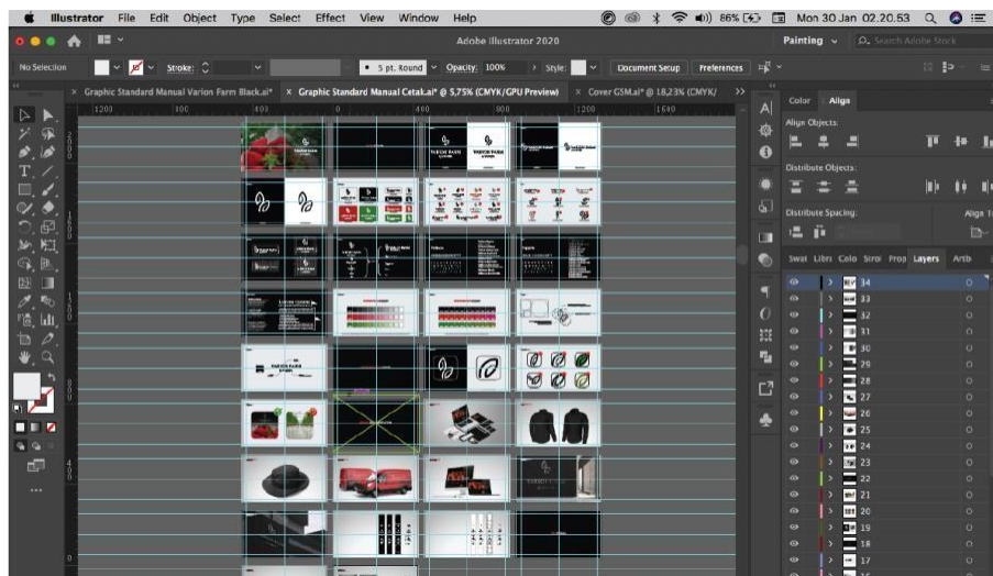
Gambar 4. Tahap digitalisasi

Kemudian setelah itu memasuki tahap digitalisasi dengan menggunakan aplikasi Adobe Illustrator CC 2020 dan mengaplikasikan sketsa ke dalam bentuk digital. Setelah itu penulis melakukan perancangan visual graphic standard manual untuk setiap aturan-aturan visual logo seperti skema warna dan pengaplikasian warna Varion Farm, clear space area pada pengaplikasian visual logo Varion Farm, grid and lines pada pengaplikasian visual logo Varion Farm, penggunaan visual logo Varion Farm yang tidak diperkenankan, perbandingan ukuran ratio Varion Farm, filosofi logo Varion Farm, supergraphic Varion Farm, dan media pendukung dari pengaplikasian visual logo Varion Farm.