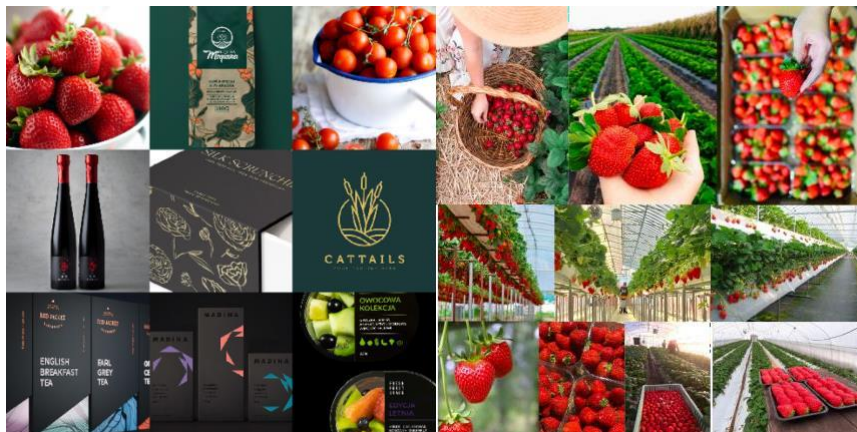
Gambar 1. Moodboard

Dalam moodboard ini merupakan referensi desain dan gambar untuk kepentingan perancangan visual graphic standard manual untuk logo Varion Farm. Kumpulan asset tersebut akan membantu penulis dalam merancang visual graphic standard manual logo Varion Farm..