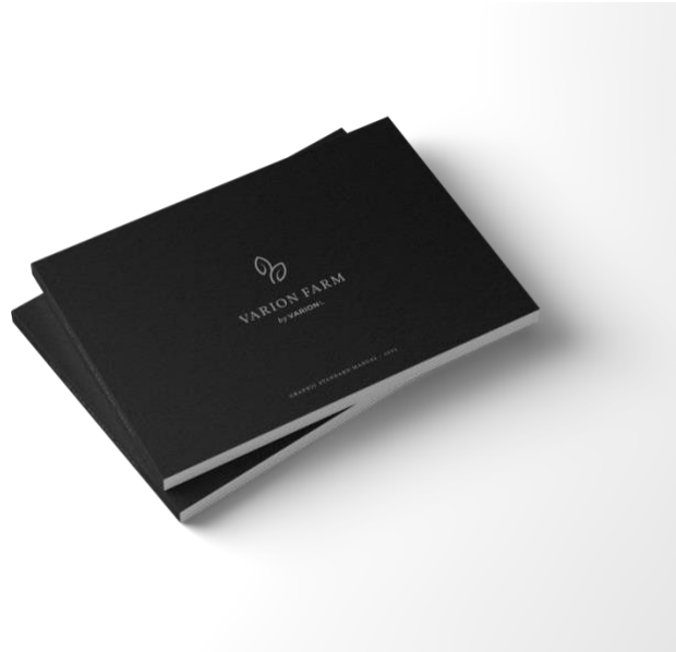
Gambar 5. Tahap akhir

Kemudian setelah melalui beberapa tahapan proses, graphic standard manual dijadikan acuan sebagai pedoman dalam pengaplikasian visual logo Varion Farm ke dalam berbagai media visual.